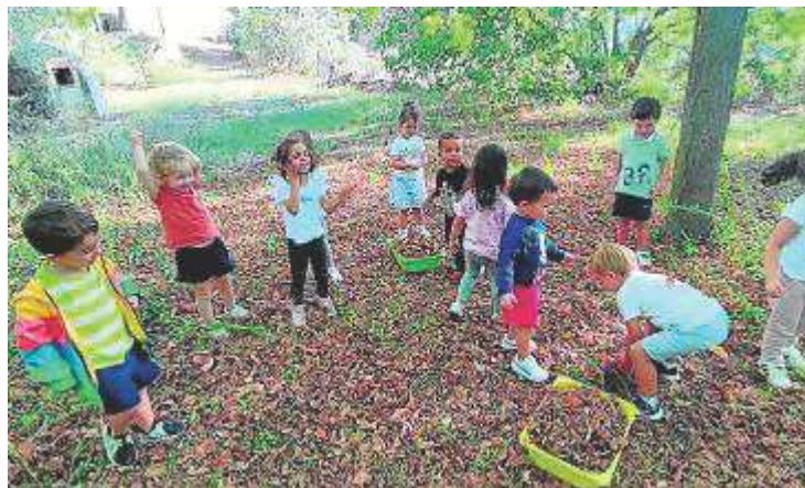
Alumnos del colegio San Vicente de Paúl. SAN VICENTE DE PAÚL BARBASTRO

Mientras en algunos lugares de Aragón el otoño parece hacerse el remolón, en otros ya llevan días celebrando su llegada e, incluso, utilizándolo de escenario para aprender una nueva lección. Así ocurre en el colegio San Vicente de Paúl de Barbastro, donde los pequeños de 3 años ya han podido comprobar los efectos de la recién estrenada estación en el bosque de arces que se levanta en su entorno. Y es que las hojas cambian de color, los árboles se quedan desnudos y las hojas secas crujen a sus pies y son perfectas para convertirse en el confeti de esta gran fiesta anual.