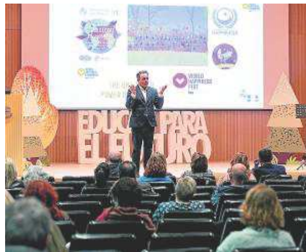
Una de las sesiones de 'Educar para el futuro'.