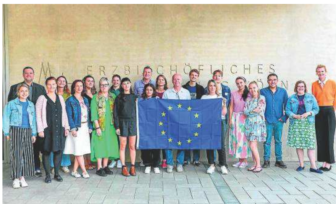
Reunión en Colonia de los participantes en el proyecto 'Children in Climate Crisis'. SANTA ANA FRAGA

Los socios del proyecto, dirigido y coordinado por el departamento de Meteorología de la Universidad de Bonn, tienen como objetivo iniciar una discusión científicamente respaldada sobre el cambio climático y la protección ambiental, especialmente dirigida a los más pequeños. Para ello, adaptarán datos científicos