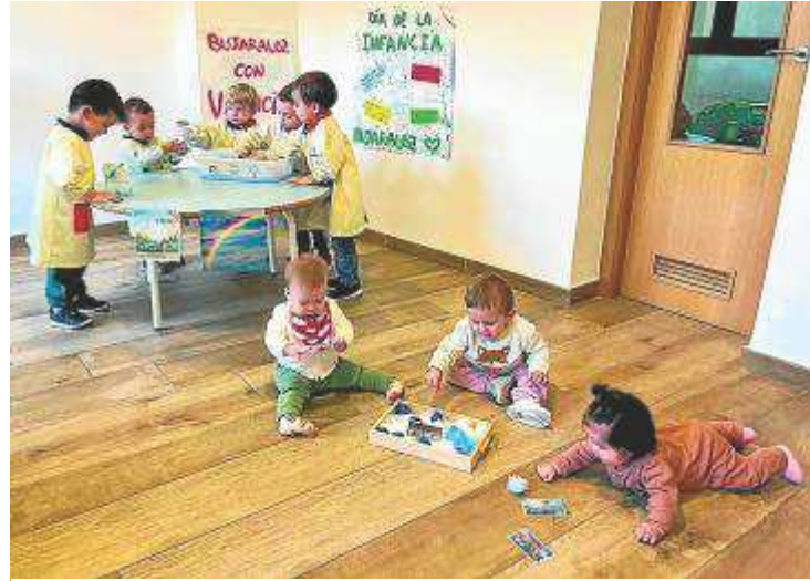
Actividades para peques. O.A. INSTITUTO DE ESTUDIOS E INVESTIGACIÓN DE LOS MONEGROS