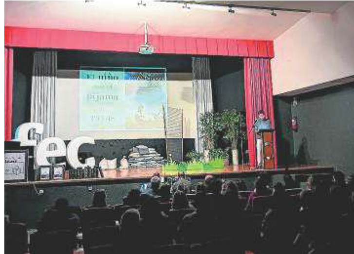
Acto central de la XII Fiesta de la Lectura. FEC CARMELITAS

Al final de la fiesta se procedió al visionado de los cortos y se entregaron los correspondientes galardones. También se otorgó un premio de reconocimiento al trabajo ganador del festival Cine y Salud que dirige Gurpegui: el corto 'Tic Tac Toc'.